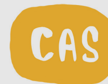
ATENCIÓN A LAS DROGODEPENDENCIAS