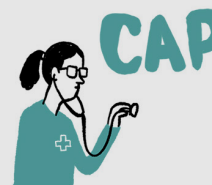
GENERAL CHECK UP