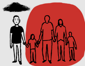
SA ATING PAMILYA AT MGA SAMAHANG FILIPINO